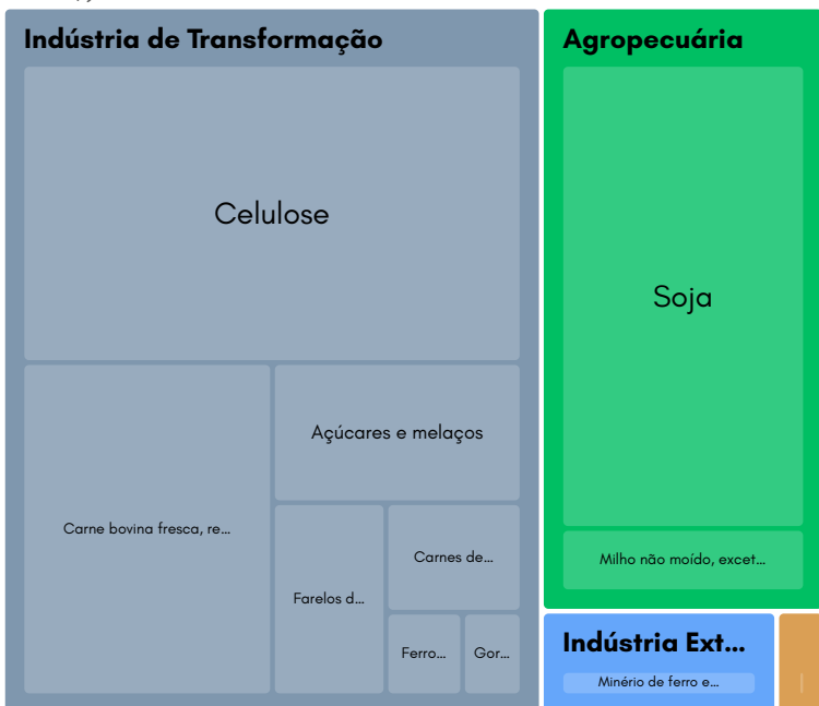
Gráfico 1: Principais produtos exportados de Mato Grosso do Sul em Jan-Out de 2025 (participação em US$)