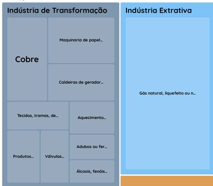
Gráfico 2: Principais produtos importados de Mato Grosso do Sul em Jan-Out de 2025 (participação em US$)