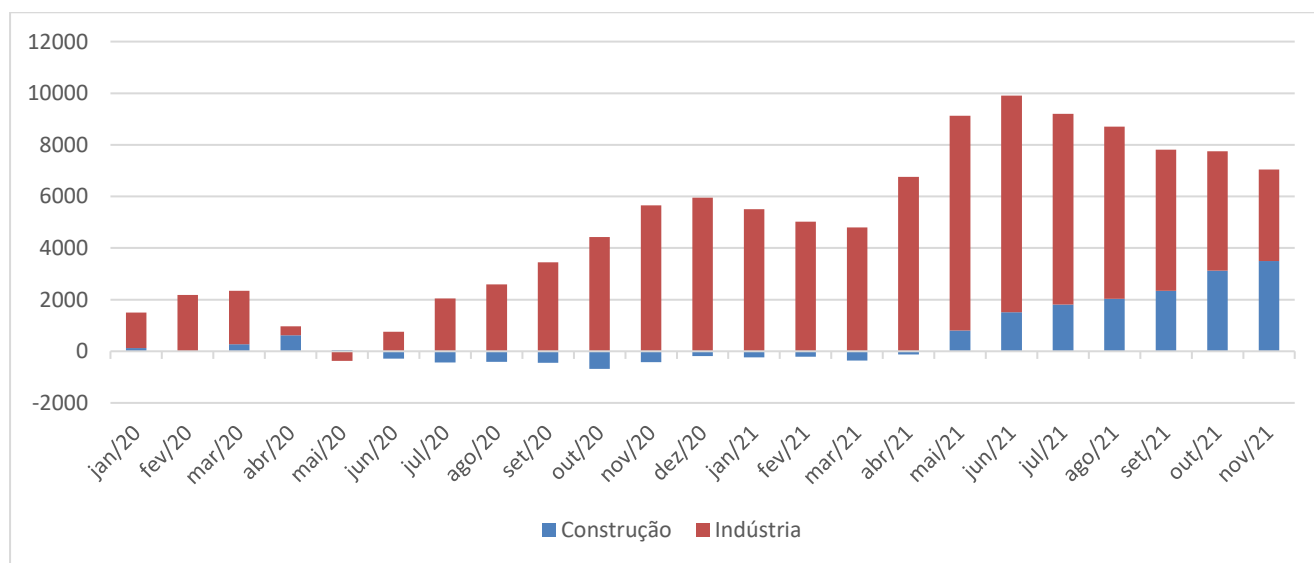
Gráfico 3 – Saldo Acumulados em 12 meses em número de empregos formais em Mato Grosso do Sul jan/2020 a nov/2021

No acumulado dos últimos 12 meses, a indústria apresenta uma criação de 3.547 novas vagas, enquanto que a Construção Civil acumula 3.502 novas vagas (Gráfico 3).