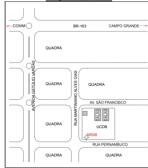
Croqui de localização

Descrição: O marco é um pilar de concreto, com 1,20m de altura (conjunto pilar e sapata), fundido em uma base de concreto armado de formato triangular. O pilar tem o formato sextavado, com 48 cm de diâmetro e com sistema de centragem forçada. No topo do marco tem um disco de alumínio inscrito o nome da estação. Para a proteção do sistema de centragem forçada com 5/8 de polegadas, feita em material de alumínio, existe uma coifa rosqueável que pode ser aberta ou fechada com chave especial. O marco pertence a Rede GPS do Estado do Mato Grosso do Sul.