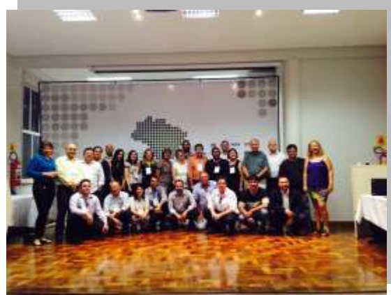
Participantes dos Núcleos Estaduais Corumbá-MS, 11 e 12 de dezembro de 2013

Da avaliação resultou o documento final denominado Carta Corumbá.